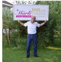
KURT SCHÄR MATERIAL / WAGENBAU