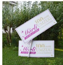
ALEX GSCHWEND SPONSORING