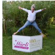
CARO LUSSI WERBUNG / KOMMUNIKATION